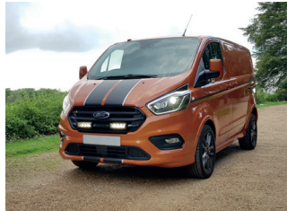
FORD TRANSIT CUSTOM 2018+