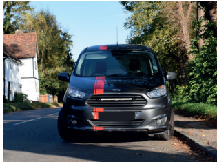
FORD TRANSIT COURIER 2014+