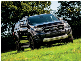
FORD RANGER 2019+