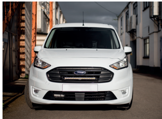
FORD TRANSIT CONNECT 2018+